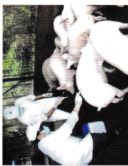
Hình ảnh tiêm phòng cho đàn lợn

✓ Thường xuyên, liên tục giám sát lâm sàng trên đàn lợn.