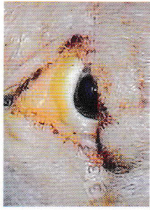
Viêm kết mạc, vàng da