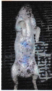
Xuất huyết dưới biểu mô lan rộng