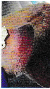
Tim chóp tai