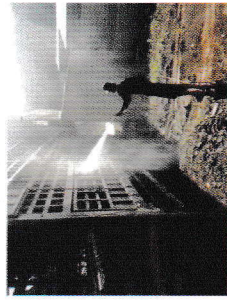
Khử trùng phương tiện ra/vào cơ sở chăn nuôi

✓ Áp dụng nghiêm ngặt các biện pháp chăn nuôi an toàn sinh học; thường xuyên vệ sinh, sát trùng khu vực chăn nuôi bằng hóa chất, vôi bột.