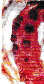
Các vết loét hình cúc áo trên niêm mạc ruột già