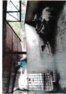
Khử trùng chuồng trại

✓ Xây dựng, duy trì cơ sở chăn nuôi lợn an toàn dịch bệnh đối với bệnh Dịch tả lợn cổ điển theo quy định.